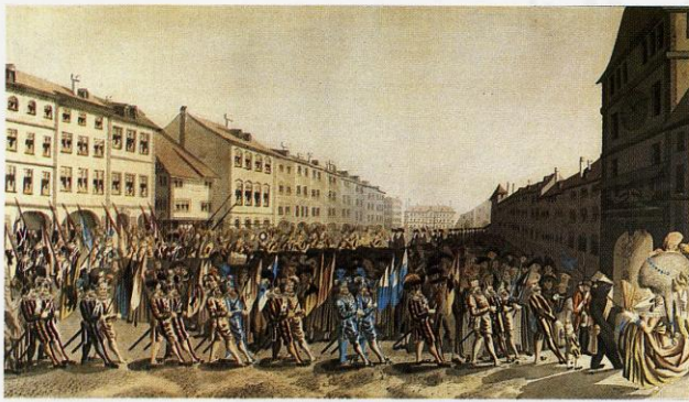
Umzug des Äusseren Standes der Stadt und Republik Bern mit Tell und seinem Sohn. Radierung von Johann Jakob Lutz um 1788/90. 35,3 x 61,2 cm. LM 66299; Dias + 8571, + 8572.

Am Ostermontag, dem Höhepunkt des politischen Lebens in Bern, fand eine Reihe von festlichen Umzügen statt. Sehr beliebt war jener des Äusseren Standes, einer Organisation der patrizischen Jugend, die als Schattenstaat Aufbau und Funktionen des Inneren Standes, d. h. der Regierung der Republik Bern, nachahmte.